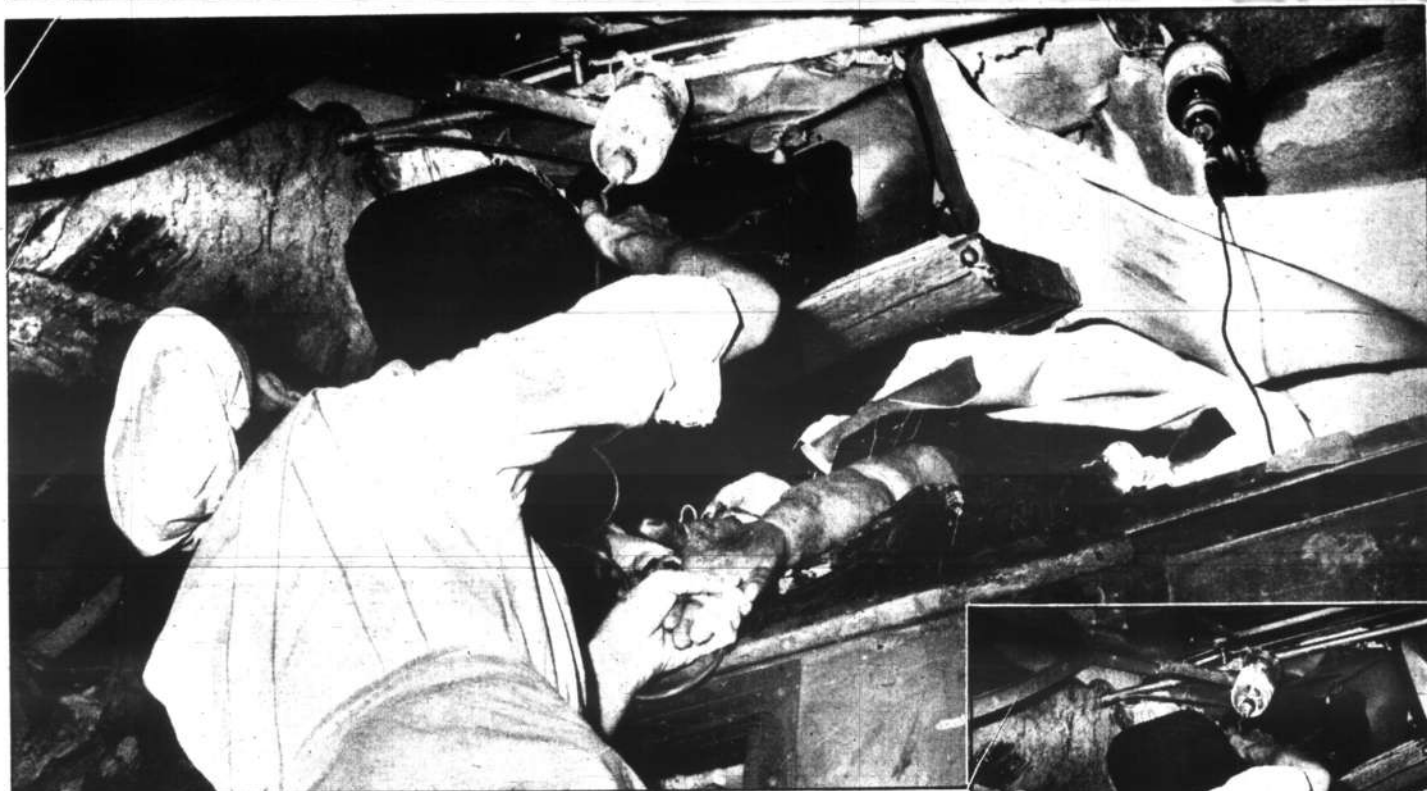
Primi soccorsi a Voghera. Trasfusioni di sangue e di plasma sono state praticate ai feriti ancora imprigionati tra i rottami del treno investito.

Trasfusioni di plasma sono state fatte a feriti imprigionati ancora fra i rottami - Lo slancio di suore e donatori di sangue