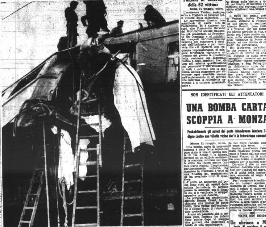
Voghera: dal groviglio di rottami e di lamiera si liberano i lamenti strazianti e sempre più deboli dei soccorritori. A destra, un ferito viene trasportato in barella. In basso, un ferito viene trasportato in barella. In basso, un ferito viene trasportato in barella.

Per tutto il pomeriggio, fino a notte inoltrata, la città di Voghera si è addensata davanti alla camera mortuaria del mistero di Voghera, dove sono stati composti i resti delle decedute vittime del disastro. Mentre le autorità procedono alla terza formalità del riconoscimento dei salmi, si rinnovano i cordogli stralciati di disperazione. Parenti e familiari, raggiunti all'ultimo momento, piangono disperatamente davanti alla catafalco o avvistano con angoscia il cadavere, non più riconoscibile per le lacerazioni e le deformazioni. Per tutto il pomeriggio, fino a notte inoltrata, la città di Voghera si è addensata davanti alla camera mortuaria del mistero di Voghera, dove sono stati composti i resti delle decedute vittime del disastro. Mentre le autorità procedono alla terza formalità del riconoscimento dei salmi, si rinnovano i cordogli stralciati di disperazione. Parenti e familiari, raggiunti all'ultimo momento, piangono disperatamente davanti alla catafalco o avvistano con angoscia il cadavere, non più riconoscibile per le lacerazioni e le deformazioni.