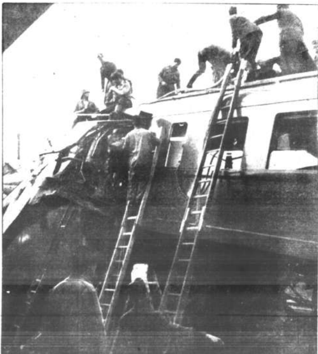
VOGHERA. — Vigili del fuoco, ferrovieri ed agenti penetrano nel vagone della morte. Sarà necessario la fiamma ossidrica per riuscire a liberare dal groviglio dei rottami i corpi martorati.